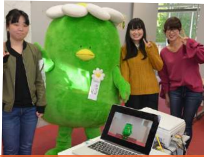
ジョーで動画撮ってみた