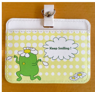
さがっぱ・ジョーとどこでも一緒！ パスケース 1,300 円