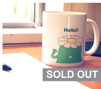
さがっぱ・ジョーといつでも一緒！ マグカップ 1,300 円