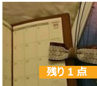
リボンループタイ 1,200 円