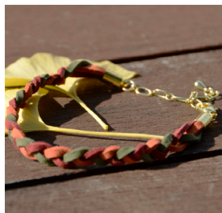
スウェッドブレスレット～ エスニック風 500 円