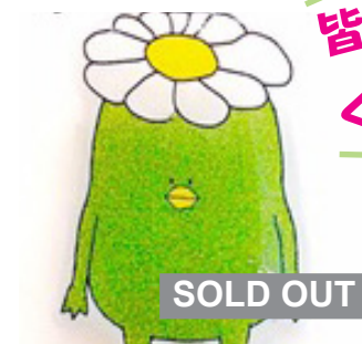
さがっぱブローチ 500 円