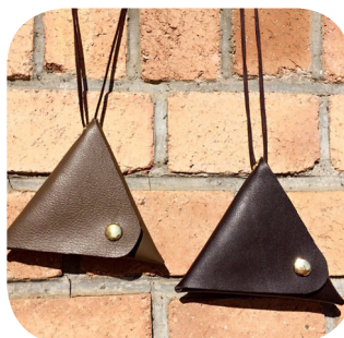
首掛けコインケース 800 円